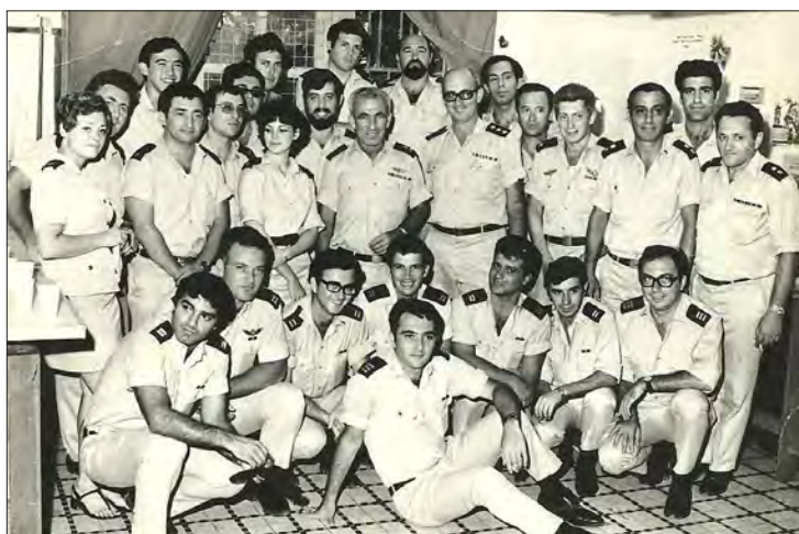
איור 3: מפקד חיל הים אברהם בוצר וראש המחלקה רמי לונץ עם קציני מחלקת מודיעין ים, קיץ 1972