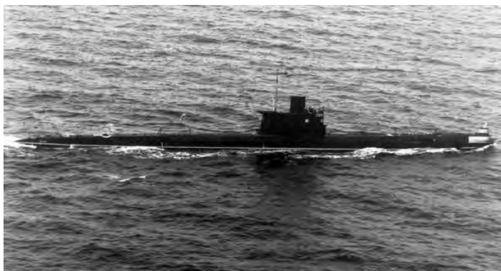
איור 4: צוללת מסדרת רומיאו מהסוג שנמכר למצרים על ידי הסובייטים, והופעל במלחמת יום הכיפורים, לחסימת השיט בים האדום

קיים פער מסוים בלוח הזמנים, אך בשני הדיווחים הצי הוא שיצא ראשון למלחמה. מודיעין חיל הים זיהה הכנות להפלגה בסוף ספטמבר, הפלגת משחתות ב-1 באוקטובר והפלגת צוללות ופריגטה ב-2 באוקטובר. 63 לנוכח המאפיינים הייחודיים של הכנות הצי למלחמה מעקב אחר הזירה הימית עשוי להניב התרעה מוקדמת על מלחמה (איור 4).