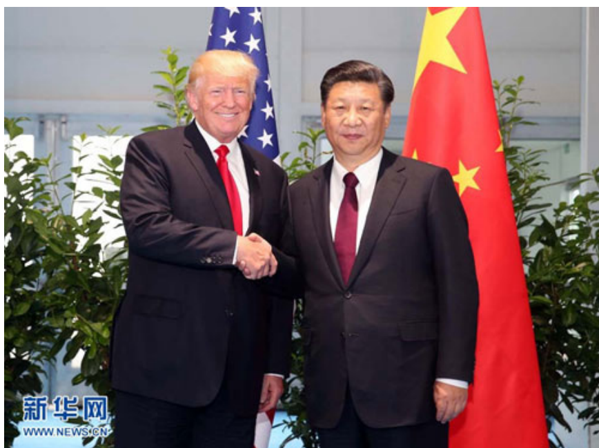
נשיא ארה"ב דונלד טראמפ ונשיא סין שי זינפינג בפגישתם יולי 2017

אף שהמחקרים המוזכרים הם אלו שתפסו את עיקר תשומת הלב של הממסד הכלכלי שקידם את תהליכי הגלובליזציה בעשורים האחרונים, קיימים מחקרים רבים המתאגרים את ההיגיון ואת הממצאים האמפיריים המוצגים במחקרים שנסקרו. מחקרים אחרים טענו, כי המחקר האמפירי המלמד כביכול שסחר מקדם את השלום, אינו נותן את הדעת לעובדה שמדינות ידידות סוחרות מלכתחילה בהיקפים משמעותיים זו עם זו, כך שמדובר על ממצא שמקורו בבעיה מתודולוגית משמעותית. ואכן, מספר מחקרים הראו כי בקרה נאותה על סדר הזמנים הופכת את הקשר בין סחר לשלום ללא מובהק. 11