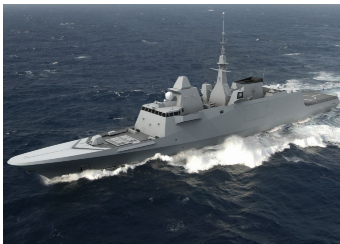
איור 1: פריגטה מדגם Fremm 25

בתוך התת-מימי, תחום ההולך ומתפתח בחיל הים המצרי, ניתן לציין את רכש ארבע הצוללות הגרמניות המתקדמות מדגם U-209 (וייתכן שבעתיד ירכשו עוד שתי צוללות). הצוללות המצריות החדשות, בדומה לצוללות הרומיאו הישנות, יצוידו בטילי ים מדגם Harpoon, כמו גם בטורפדו גרמני מתקדם ובמוקשים ימיים. 22 רכש הצוללות החדשות נעשה בהמשך לשדרוג שבוצע בצוללות הישנות בסוף שנות התשעים של המאה הקודמת, ולרכש מערכות סונר אמריקניות לגילוי צוללות, אשר הותקנו על גבי ציידות הצוללות הסיניות מדגם Hainan. 23, 24