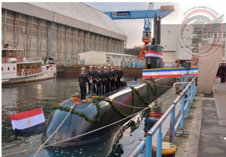
איור 3: טקס מסירת צוללת U-209 לחיל הים המצרי בגרמניה 34