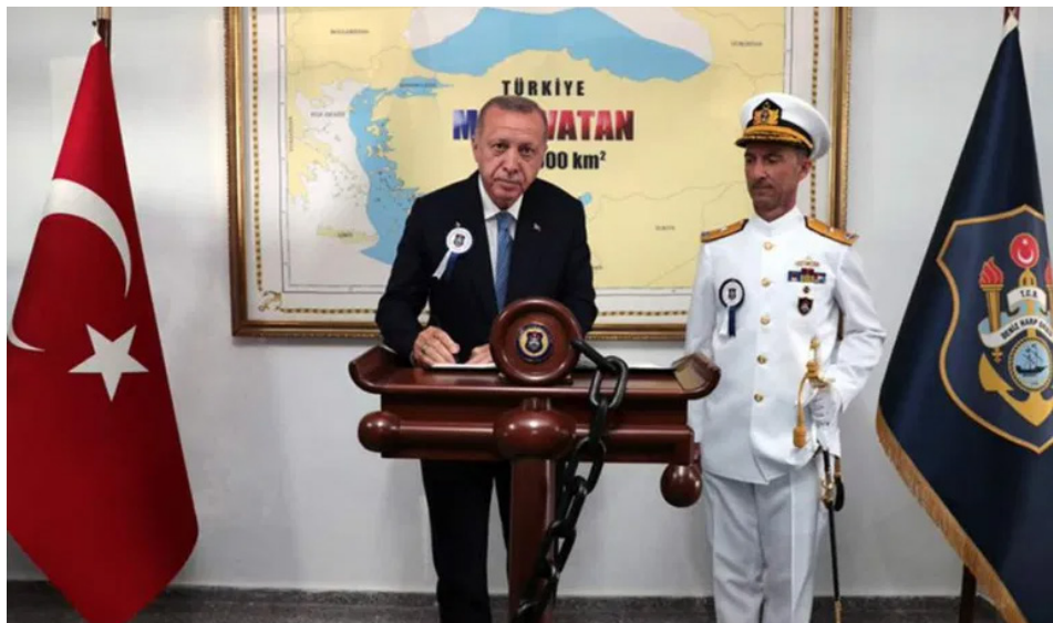
איור 1: מפת המולדת הכחולה מאחורי הנשיא ארדואן 1

עם מדינות "לא מוסריות" – כינוי שיוחס למצרים בראשות א־סיסי (Abdel Fattah Al-Sisi), כמו גם לסוריה בראשות אסד, ליוון וישראל. מבחינה פנימית, ארדואן מתקשה לגייס תמיכה ציבורית רחבה, ולכן הגנה על מה שנתפס כאינטרס הלאומי של טורקיה תוך עימות עם מדינות המערב עשויה להוביל 'להתכנסות סביב הדגל' ולהגדיל את הפופולריות שלו. גם העובדה שהקואליציה הפנימית של ארדואן כוללת את המפלגה הלאומנית, שהאדמירל גורדניז הוגה דוקטרינת "המולדת הכחולה" הוא אחד מחבריה, השפיעה ככל הנראה על אימוץ הדוקטרינה. באוגוסט 2019 נאם הנשיא ארדואן בפני בוגרים של אקדמיית הצי הימית, ומאחוריו ניצבה מפה שמתווה את גבולות "המולדת הכחולה" – מֶסֶר ברור בדבר אימוץ הדוקטרינה בידי ממשלתו.