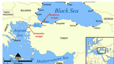
איור 1: מפת המיצרים הטורקיים