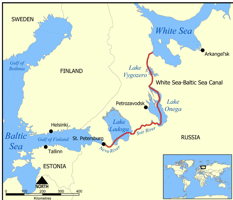
איור 2: נתיב תעלת הים הלבן שנפתחה בשנת 1933

התוצאה הישירה של החלטה זו הייתה ירידה במעמדם של ציי הים הבלטי והים השחור, אשר היו קודם לכן הציים המובילים בכוחות הסובייטיים, ועלייתם של הצי הצפוני וצי האוקיינוס השקט. בין הסיבות לכך היו שלוש עיקריות: