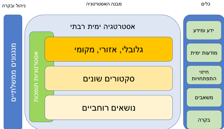
איור 2. מבנה כולל לאסטרטגיה ימית

המקום של ישראל בין ים סוף לים תיכון ובין נמלי ישראל השונים, כל אחד במקומו וסביבתו וההשפעות על מרחב החוף ואזורי איים פוטנציאליים וכדומה.