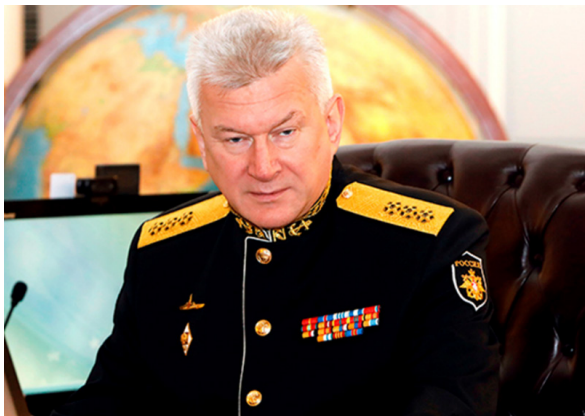
איור 1: מפקד הצי הרוסי אדמירל אבמנוב

רוסיה מציינת את השנה ה-237 להקמת צי הים השחור. באירוע יום השנה (13 מאי) הדגיש מפקד הצי הרוסי האדמירל Nikolai Evmenov את תפקידו החשוב של צי הים השחור בשמירת היכולת המבצעית הקבועה של הצי הרוסי בים התיכון. "Permanent Operational Formation of the Russian Navy in the Mediterranean Sea" 2 . עוד התייחס (שם) לפיתוח יכולות צי הים השחור ורכישת ניסיונו המבצעי המצטבר לאור השתלבותו בלחימה כנגד מטרות טרור בסוריה.