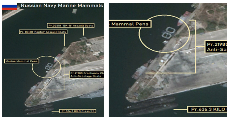
איור 5: כלובים כנראה של יונקים ימיים ברציף בנמל טרטוס. 19

הניכרים לתשתיות. לכל אלה נוספו השנה גם משתני איזודאות לנוכח משבר הקורונה. מאפיינים מקומיים בגזרת החוף הסורי כללו גם ניסיונות נשנים לתקיפות הבסיסים הרוסיים מצד גורמי אופוזיציה וטרור מקומיים באמצעות רחפנים ושיטות אחרות. נוסף על כך, שריפות מקיפות פקדו באוקטובר 2020 את אזור השליטה 'העלאווי' המדובר שבחוף הסורי. בין יתר המענים הרוסיים להגנה על בסיסיהם בסוריה אשר משלבים אמצעים שונים, ניתן להצביע על פריסה בנמל טרטוס (לפחות לפני שנתיים) כנראה של כלובי יונקים ימיים למטרות הגנה תת־ימית (ראו איור 5).