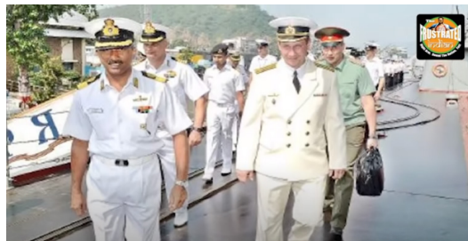
איור 8: מפקדי התמרן הימי המשותף לצי רוסי והודו "Indra" (ספטמבר 2020) על סיפון אוניית הפיקוד 29

זירת התחרות האפשרית שהוזכרה לעיל בין רוסיה לסיין, המתייחסת לזיכיון בשליטה בנמל אלכסנדרופוליס היווני אינה המחלוקת היחידה בין שתי המעצמות, שכן גם אם זו תמומש בסוף, הרי שתהווה אך ייצוג אזורי לתחומי מחלוקת ימית מקיפים בהרבה. בראשם ראוי להתייחס לשליטה בים הצפוני הארקטי ולבעלות על אוצרות הטבע הנמצאים שם מתחת למעבה הקרח המפשיר בשנים האחרונות ובעתיד הצפוי לבוא. תחום ימי אחר שהוזכר ומשמש כר למתיחות הוא הקשר הרוסי המתפתח עם הודו. בין היתר קשר זה הקיף השנה תמרן ימי רוסי-הודי משותף במצרי מאלקה (Malacca Strait). זה התרחש בראשית ספטמבר 2020, ומהווה מסר במיוחד כלפי סין (איור 8). כמו כן, הקשרים עם הודו מקיפים גם רכש של אמל"ח רוסי לא רק ימי, ופיתוחו במשותף בין שני הצדדים. אספקת הנשק להודו מוכרת מאז העידן הקומוניסטי.