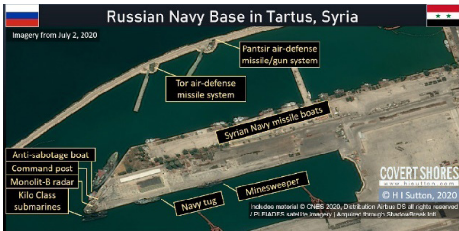
איור 7: פריסת כלי שיט רוסיים בבסיס בטרטוס (2 ביולי 2020) 26

נראה כי ביסוס אחיזת החלוץ הקדמית בסוריה ובנמל הימי בטרטוס הקנו לרוסיה יציבות, המשכיות והזדמנות לניצול יתרונות גאוגרפיים–מרחביים כדי להתפרס לעבר מחוזות נוספים במרחב הים תיכוני, גם הם בריחוק יחסי מהמולדת הרוסית. המוקד הנוסף שבו נאחזה רוסיה השנה הוא לוב. רוסיה פועלת כאמור בלוב במרוצת השנה האחרונה לסייע לכוחות 'הצבא הלאומי המזרחי הלובי' (Libyan National Army – LNA) בפיקודו של הגנרל חליפה הפתר כנגד כוחות הממשלה הלאומית בטריפולי (GNA – Government National Accord). רוסיה משלבת פעילותה זו במסגרת קואליציה עם מצרים, מדינות מאיחוד נסיכויות המפרץ הפרסי, צרפת ואחרות. מחוזות פעילות נוספים בצפון אפריקה כוללים את מצרים ואלג'יריה. במזרח אפריקה ובים האדום מדובר בהיאחזות שתתבסס כנראה על סודאן. ניצול המרחב מלווה ביתרונות פוליטיים–מדיניים לרוסיה, גם אם חשיבותם אינה שקולה ל"שכפול הפעילות הרוסית במרחב הימי שמול חופי סוריה". 27