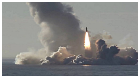
איור 4: ניסוי שיגור טיל בליסטי מצוללת, Burei R-30 'Bulava' intercontinental ballistic, 3 בנובמבר 2020

2020 (איור 3). 7 כמו כן ב-3 בנובמבר 2020 דווח על שיגור של טיל בליסטי 'Bulava' R-30 (intercontinental ballistic missile) (איור 4), מצוללת מדגם BUREI, פרויקט 995. 8 כן דווח לאורך השנה על מספר מקרים של מסירת כלי שיט חדשים לידי הצי, בעוד הנשיא פוטין עצמו נכח (ראשית נובמבר) בטכס הנפת 'אות שירות מבצעי' לשוברת קרח שנבנתה במספנות "סן פטרסבורג". שם כלי השיט: "Viktor Chernomyrdin" 9 מפרויקט 22600 (אין מדובר בדגם השוברות בהנעה גרעינית 22220 המצויות עדיין בשלבי בנייה). נוכחות פוטין באירוע מדגישה את החשיבות הרבה שהוא מייחס לפיתוח משמעותי של האזור הצפוני הארקטי עבור רוסיה.