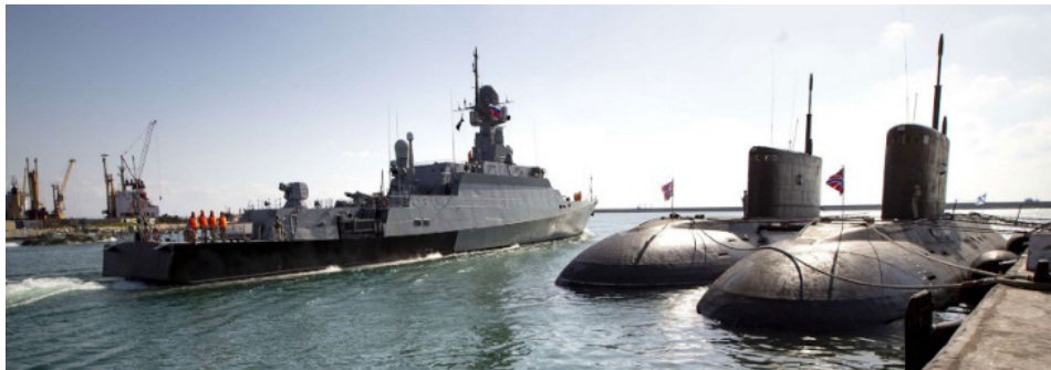
איור 6: פריסת כלי שיט קו ראשון בנמל טרטוס, 2 צוללות קילו והפריגטה מדגם אדמירל גריגורוביץ (Admiral Grigorovich) (11 באוקטובר, 2020) 25

נמל טרטוס הסורי שימש נקודת אחיזה משמעותית לצי הרוסי בים התיכון מאז שנת 1971, כאשר גובשה הסכמה לשימוש ימי סובייטי בנמל מול הנשיא ח'אפז אסד האב. ההסכמה לכך התרחבה בשנת 1974 לאחר מלחמת יום הכיפורים. הנוכחות הרוסית בנמל נשמרה אפוא כחמישים שנה מאז ועד היום, והתרחבה בשנים האחרונות, כפי שצוין לעיל. רוסיה הכריזה (בשלהי 2019 עוד טרם התפרצות מגפת הקורונה) על כוונתה להשקיע כחצי מיליארד דולר בנמל לשם הרחבת התשתיות במקום. 23 אפשר שהרחבה תבוצע בהיקף שונה (ונמוך) יחסית לזה שננקב. מקרב המניעים התומכים בביצוע ההרחבה, לרוסיה יש עניין בהקרנת התחזקות עוצמתה במקום, ולו כלפי מעצמות אירופה, וכן כלפי שחקנים אחרים במזרח התיכון. האחרונים חוששים מכך שפיתוח רוסי זה יוכל לאפשר איום עליהם, לנוכח האפשרות "להתאימו לפעילות הצבאית". 24 האחיזה בנמל טרטוס מומחשת באיורים 6-7.