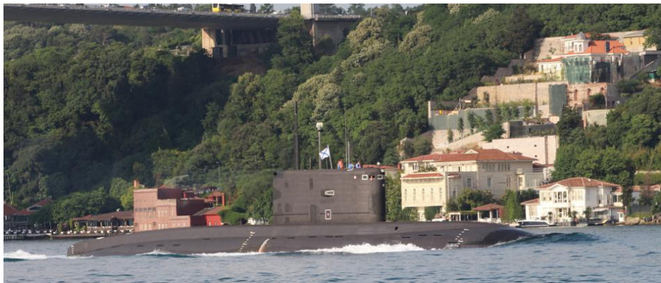
איור 2: צוללת "קילו" רוסית בעת המעבר במצרים הטורקיים ב-24 ביוני 2020 5

גרסימוב (Valery Gerasimov) התקיים השנה (21–26 בספטמבר 2020) בחזית הדרום. במסגרתו נטלו חלק גורמים מצי הים השחור, משייטת הים הכספי, לרבות 20 כלי שיט. כמו כן, התבצע שיגור ירי טילים ואמל"ח בחלקם נכח הנשיא פוטין. 4 בשלהי ספטמבר ערך הצי הרוסי תמרון משותף עם הצי ההודי, זו השנה השנייה ברציפות. למהלך הימי של שיתוף הפעולה בין ציי שתי המדינות יש השלכות גאואסטרטגיות המופנות בעיקר כלפי סין (ראו בהמשך).