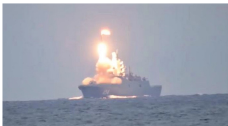
איור 3: ניסוי שיגור טילי ים Tsirkon hypersonic missile, 7 באוקטובר 2020