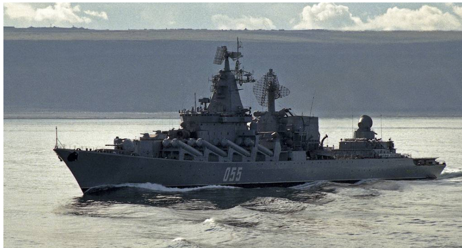
איור 1: הסיירת "מרשל יוסטינוב" מדגם סלאבה 4

א. כוח הסיירת "מרשל יוסטינוב" (איור 1) מדגם סלאבה מלווה בשני כלי שיט עזר יצא מנמל הבית בסברומורסק (Severomorsk) בראשית יולי 2019. לאחר השתתפות ביום הצי הרוסי הפליג הכוח לים התיכון, בו פקד את נמלי אלג'יר, מצרים, טורקיה, יון וקפריסין. ההפלגה נמשכה באוקיינוס האטלנטי, בפקידת נמלים במערב אפריקה ועד להגעה לדרום אפריקה. בנמל קייפטאון (Cape Town) השתלב הכוח לראשונה בתמרון ימי משותף לצי הסיני ולצי המקומי המארח. הכוח שב בתעלת סואץ, והגיע לים השחור לנמל סבסטופול (Sevastopol) ב-25 בדצמבר 2019, שם צפוי להשתלב באימונים שצפויים להיערך בראשית ינואר 2020.