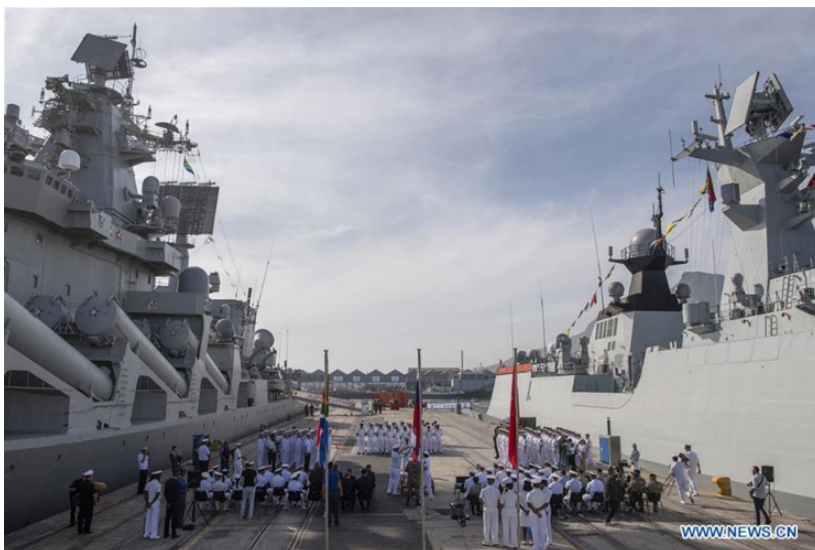
איור 7: קייפטאון, דרום אפריקה – ביקור סיירות טילים מרוסיה וסין במהלכו התבצע אימון משולש עם הצי המארח הדרום אפריקאי 31