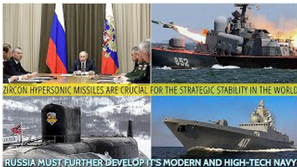
איור 2: מתוך פורום פיתוח הצי הרוסי 8

הנשיא פוטין הוסיף והתייחס לחשיבותו ההיסטורית של הצי, תוך שהצביע על תרומתו לשמירת הביטחון הרוסי וקיום האינטרסים של רוסיה בעולם. 9 כן הוסיף 10 שבשנת 2019 מגוון פעילויות הצי הרוסי כלל 111 הפלגות במשימות של הגנה על הספנות ומניעת פירטיות. בהן נכללו 70 ספינות שטח, 27 אוניות עזר ו-15 צוללות (במשימות שונות). מבין זירות הפעולה השונות בעולם ובמרחבי האוקיינוסים נקב הנשיא בים סין הדרומי, מפרץ עדן, מיצרי מאלקה וסינגפור, כמו גם הקריביים. 11