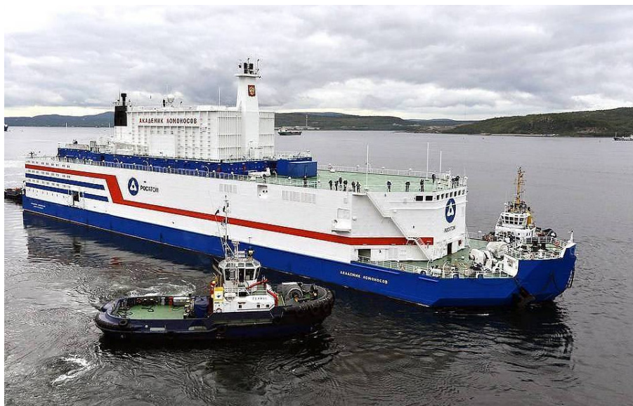
איור 3: אסדת האנרגייה הגרעינית "Akademik Lomonosov"

1. הצבתה ושילובה הפעיל של אסדת האנרגייה הגרעינית "Akademik Lomonosov". מדובר באסדה הראשונה מסוגה בעולם לייצור חשמל (איור 3), אשר נגררה בים כשלושה חודשים לעבר העיר פאווק (Pevek) שבמזרח האזור הארקטי. יש לציין כי רוסיה פועלת כיום לבניית יחידות כורים צפים נוספים, חלקם יוצבו באזור הארקטי בעתיד.