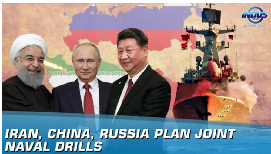
איור 6: התמרונים המשותפים לציי סין, רוסיה ואיראן 28

אימון משותף נוסף לציי רוסיה וסין (סוף נובמבר – תחילת דצמבר 2019) נערך בקייפטאון, לראשונה באזור זה (איור 7) בשיתוף חיל הים המארח – הדרום אפריקאי. האימון מבטא הפגנת עוצמה משותפת של מעצמות אסיאתיות אלו גם באזור זה, תוך כדי הדגשת המשמעות שאותה מייחסות שתיהן לעצם כינון הקשרים והנוכחות שלהן ביבשת אפריקה ובתווך הימי שבינה לאסיה. 29 מהלכים אלו נדונו ותואמו כנראה בין רוסיה וסין גם בפסגה שהתקיימה ביניהן בסוגיות המזרח התיכון ואפריקה במוסקווה ב-11 באוקטובר 2019. 30