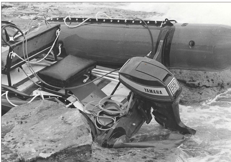
איור 1: סירת הגומי איתה חדרו המחבלים לחוף נהרייה

בחוף. הפיגוע בנהרייה בליל 24-25 ביוני 1974 היה של חוליית מחבלים השייכת לארגון פת"ח מלבנון. בפיגוע זה נהרגו חייל אחד ושלושה אזרחים ונפצעו שישה. המחבל חוסל בסופו של דבר על ידי כוח גולני. במהלך אותו עשור התרחש הפיגוע במלון "סבוי" בחוף תל אביב, במרס 1975. שתי חוליות מחבלים הגיעו בעזרת סירות לחוף תל אביב והשתלטו על מלון "סבוי", תפסו בני ערובה, ואיימו להרוג אותם אם ישראל לא תשחרר 20 מחבלים בתוך ארבע שעות. למחרת פרצה ל"סבוי" יחידה של סירת מטכ"ל, הרגה שבעה מחבלים ותפסה אחד, בעוד חמישה בני ערובה חולצו, שמונה נהרגו במהלך הפריצה, ושניים מחיילי הכוח הפורץ נהרגו גם הם.