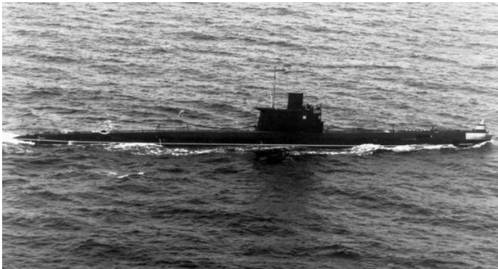
איור 4: צוללת מסדרת רומיאו מהסוג שנמכר למצרים על ידי הסובייטים, והופעל במלחמת יום הכיפורים, לחסימת השיט בים האדום

קיים פער מסוים בלוח הזמנים, אך בשני הדיווחים הצי הוא שיצא ראשון למלחמה. מודיעין חיל הים זיהה הכנות להפלגה בסוף ספטמבר, הפלגת משחתות ב-1 באוקטובר והפלגת צוללות ופריגטה ב-2 באוקטובר. 63 לנוכח המאפיינים הייחודיים של הכנות הצי למלחמה מעקב אחר הזירה הימית עשוי להניב התרעה מוקדמת על מלחמה (איור 4).