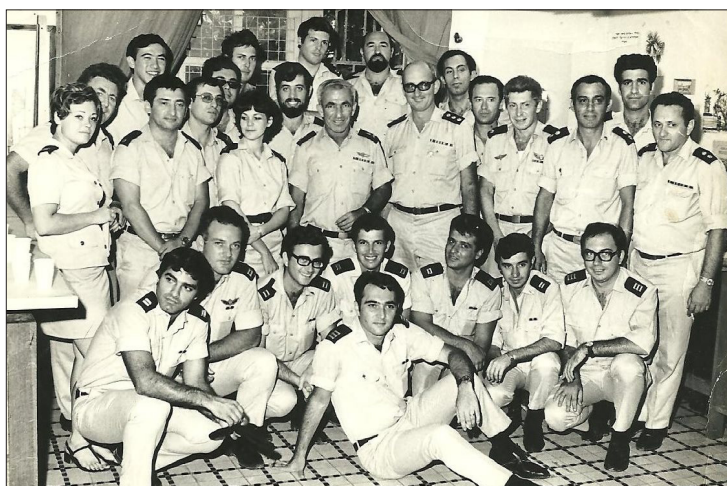
איור 3: מפקד חיל הים אברהם בוצר וראש המחלקה רמי לונץ עם קציני מחלקת מודיעין ים, קיץ 1972