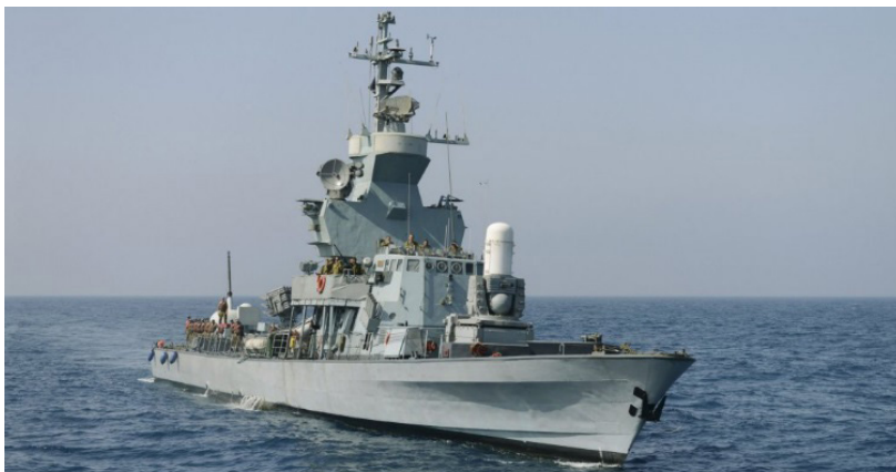
איור 5: אח"י כידון מדגם סער 4.5

הגוף זיכתה את הספינה בקווי זרימה טובים יותר, וכל הספינות שנבנו מאוחר יותר נעשו לפי התכנון המוארך, וזכו לשם "סער-4.5".