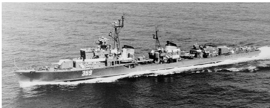
איור 1: משחתת סקורי

האיום העיקרי לביטחון ישראל בזירה הימית היה משחתות ה"סקורי" הסובייטיות שבידי המצרים. שלוש המשחתות הישראליות מתוצרת בריטניה 3 היו נחותות מהן, וחיל הים חיפש מענה יעיל כנגדן. הטרפדות – סוג הספינות השני שהיה ברשות חיל הים – היו יעילות כספינות תותחים מהירות נגד מטרות קטנות. נשק הטורפדו חייב התקרבות לטווח קצר אל כלי האויב, מה שגרם לטרפדות להיות נחותות מול תותחי משחתות ה"סקורי".