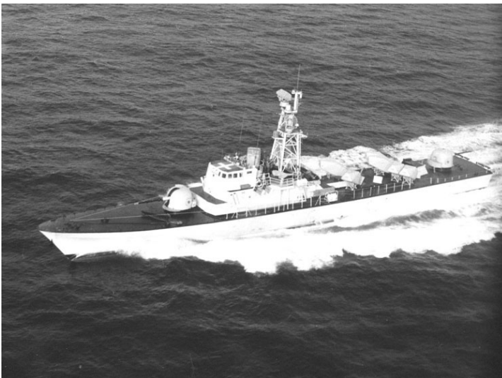
איור 4: אח"י קשת מדגם סער 4

ההצלחה במלחמה הביאה לכך שנרכשו ספינות סער-4 ממספנות ישראל על ידי צי דרום אפריקה. ספינות משומשות שיצאו משימוש של חיל הים נמכרו לציי צ'ילה, סרילנקה ומקסיקו.