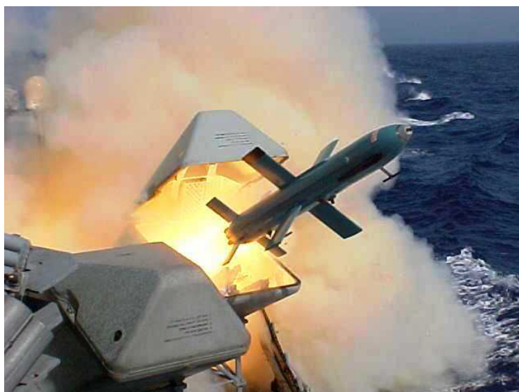
איור 2: טיל גבריאל מסער 4

חזונו של משה דיין לגבי הים האדום, אשר לא היה מקובל כלל וכלל על הרמטכ"ל חיים בר-לב, הוא שפתח את הדרך להתקדמות הטכנולוגית והכמותית של סדר הכוחות הימי.