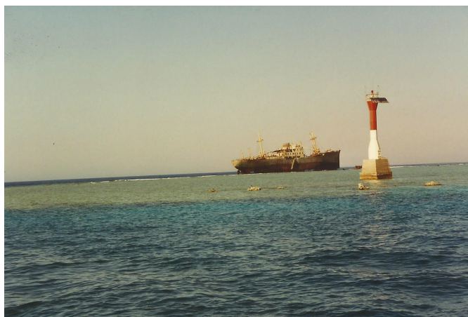
איור 2. מגדלור וספינה טרופה על גבי שונית במרכז מצר טיראן (אהוד גונן)

נראה כי ייתכן מצב, לפחות בראי משפט הים, שבו עלולים הדברים להידרדר שוב למצב שלסעודיה תיתכן זכות לשלול את זכות המעבר במצרים הסמוכים לחופיה מכלי שיט ישראלים ומכלי שיט העושים דרכם אל ישראל או ממנה. בהיעדר הסכם מפורש בין ישראל לסעודיה ייתכן שאנו חשופים שוב לסכנת חופש השיט במצרים. במובן זה המצב הקיים חמישים שנה אחרי מלחמת ששת הימים הוא בבחינת תם ולא נשלם.