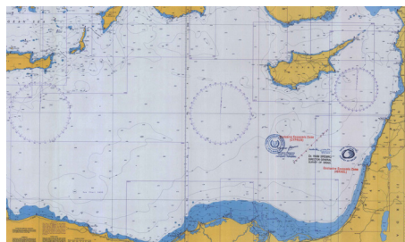
איור 1: נספח 2 להסכם בין ישראל לקפריסין

לאור העובדה כי לעת זו קיימת מחלוקת גלויה בין לבנון לישראל, פרק זה יתמקד במחלוקת סביב הגבול הצפוני בלבד. 17 בבסיס המחלוקת עומדת נקודת הגבול הצפונית (נקודה 1) המשיקה לשלוש המדינות – ישראל, קפריסין ולבנון. בעוד ישראל מסתמכת על ההסכם עם קפריסין כ"עוגן" לשם תיחום גבולה הצפוני, נקודה 1 אינה מוכרת על ידי לבנון והיא נתונה למחלוקת בינלאומית. מחלוקת זו הובילה את ישראל ולבנון להגיש לאו"ם הכרזות חד-צדדיות סותרות בדבר תיחום גבולן הימי. להלן תפורט השתלשלות זו.